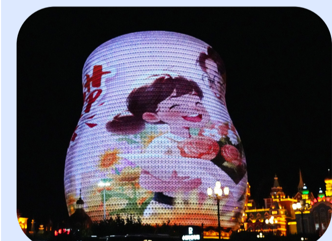
套娃智慧酒店灯光璀璨。