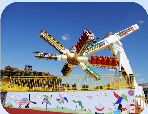
套娃景区内游乐设施丰富。