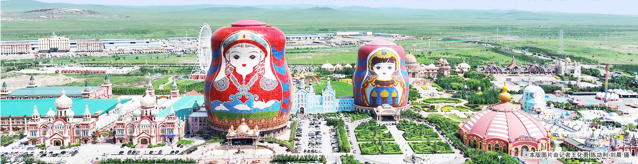
□本版图片由记者王化勇、陈功利、刘晨摄